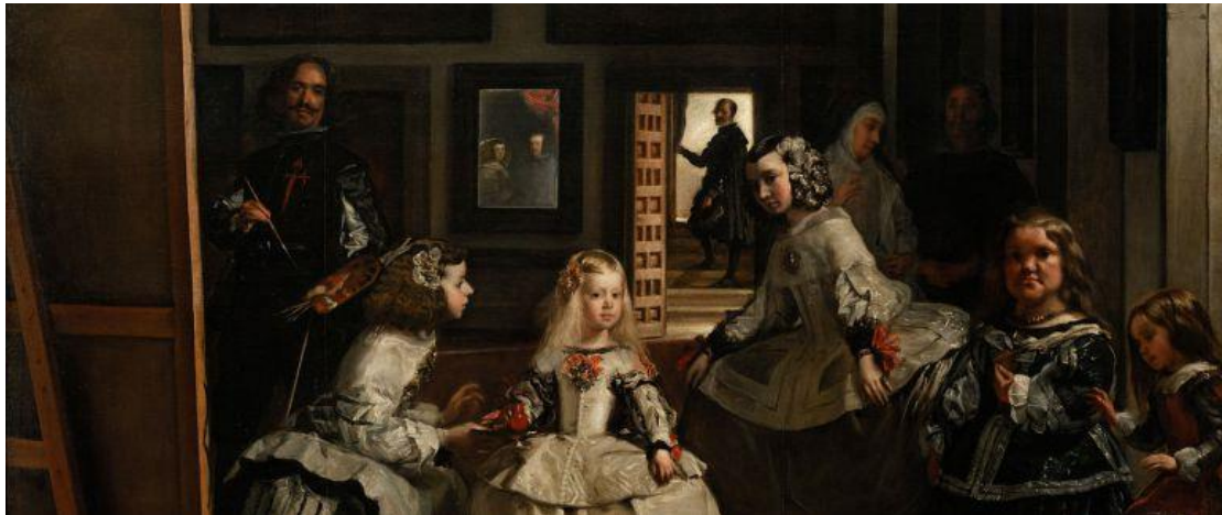
Detalle de Las Meninas obra pictórica de Diego Velázquez

La música, la pintura, la arquitectura y la escultura fueron también importantes tendencias alimentadas por la exageración de las formas y la abundancia del contenido (de donde proviene hoy en día el uso de la palabra barroco, es decir, recargado). Durante su estadía en las cortes, Calderón conoció al pintor Diego Velázquez, y se dice que puso en escena mucho de lo que el pintor incluyó en sus cuadros: una escena recargada de objetos, personajes y situaciones.