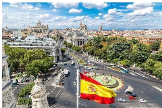
Plaza de Cibeles. Madrid en la actualidad.

¿Conoces España? ¿Has viajado alguna vez a Madrid? Marca la o las respuestas correctas sobre España y la ciudad de Madrid, donde sucede nuestra obra.