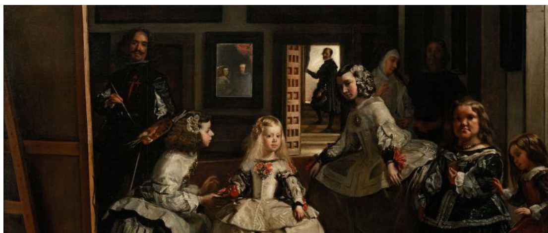
Detalle de Las Meninas obra pictórica de Diego Velázquez

La música, la pintura, la arquitectura y la escultura fueron también importantes tendencias alimentadas por la exageración de las formas y la abundancia del contenido (de donde proviene hoy en día el uso de la palabra barroco, es decir, recargado). Durante su estadía en las cortes, Calderón conoció al pintor Diego Velázquez, y se dice que puso en escena mucho de lo que el pintor incluyó en sus cuadros: una escena recargada de objetos, personajes y situaciones.