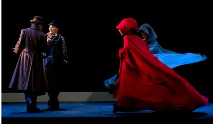
La imagen pertenece a la puesta en escena por la Compañía Nacional de Teatro Clásico. Dirección: Helena Pimenta.

Este año La Mansarda enriquece su repertorio de teatro en español con la puesta en escena La dama duende de Pedro Calderón de la Barca, máximo exponente del teatro barroco del Siglo de Oro español. Este año nuestra propuesta se centra en la más animada de las obras conocidas como “de capa y espada” dentro del repertorio del autor. La preferida por parte del público de la época por la cantidad de enredos e intrigas dentro de la estructura dramática que llevan a un final feliz y la victoria del amor. La obra se centra en las temáticas populares en el teatro de mitad del siglo XVII, tales como la defensa del honor y la virtud femeninas, y la respuesta por parte de las mujeres a las limitaciones propias de la época.