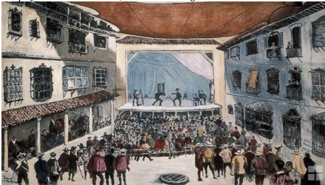
Un típico corral de comedias del siglo XVII

Lope de Vega hizo numerosas aportaciones al teatro universal. De gran imaginación, de la que se aprovecharon sus contemporáneos, tomando temas, argumentos y motivos. Su teatro, rompe con las unidades de acción, lugar y tiempo y también con el estilo, mezclando lo trágico con lo cómico.