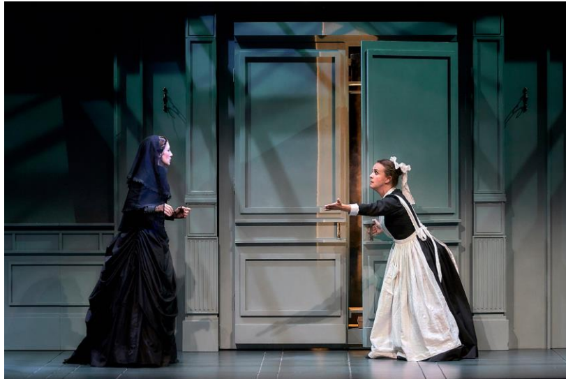
La imagen pertenece a la puesta en escena por la Compañía Nacional de Teatro Clásico. Dirección: Helena Pimenta.

Nosotros nos concentraremos en la tercera categoría, llamada “de capa y espada” que es la que incluye la obra que analizaremos.